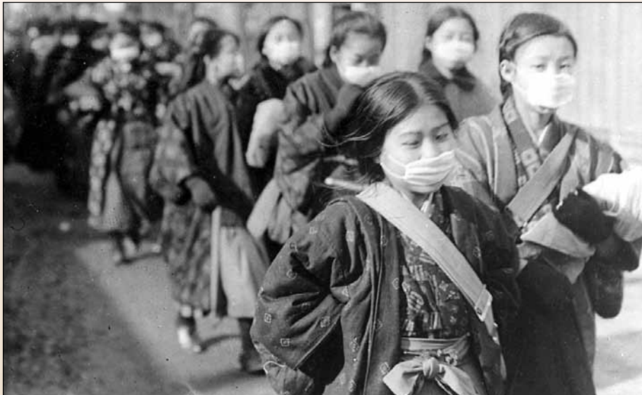
Japanische Schülerinnen in Tokio tragen Atemmasken während der weltweiten Grippewelle der Jahre 1918-19. Obwohl die Grippe selten tödlich verläuft, starben in der damaligen Epidemie weltweit zwischen 25 und 40 Millionen Menschen.

In 3. Mose 26, Vers 6 lesen wir: „Ich will Frieden geben in eurem Lande, dass ihr schlafet und euch niemand aufschrecke.“ Diese Sicherheit steht im starken Kontrast zum roten Pferd des Krieges und ist ein Geschenk Gottes an die Menschen, die ihm von Herzen konsequent gehorchen. In den Versen 3-4 heißt es: „Werdet ihr in meinen Satzungen wandeln und meine Gebote halten und tun, so will ich