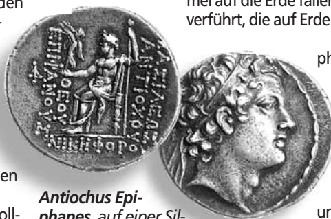
Antiochus Epiphanes, auf einer Silbermünze abgebildet, verbot viele Aspekte der jüdischen Religion und entheiligte den Tempel in Jerusalem.

Gott wird seinen Sohn zur Erde senden, um die „große Trübsal“ zu beenden, damit so der Selbstmord der Menschheit verhindert wird. Durch die Prophezeiungen der Bibel sind Christen nicht ohne Vorwarnung über diese kommende Zeit.