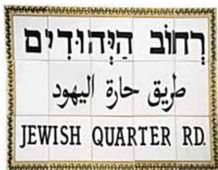
Ein Straßenschild aus Fliesen in Jerusalem – in Hebräisch, Arabisch und Englisch – erinnert an die unterschiedlichen Kulturen, die in der Stadt vertreten sind, und an ihre turbulente Geschichte.

S eit Oktober 2015 griffen wochenlang fast täglich Palästinenser Israelis mit Messern an. Die Attacken von Palästinensern und israelischen Arabern, die sich hauptsächlich auf Jerusalem und seine Umgebung konzentrierten, alarmierten die Öffentlichkeit. Die Angreifer gingen auf jüdische Israelis los: Zivilisten, Wachleute, Soldaten, Polizisten.