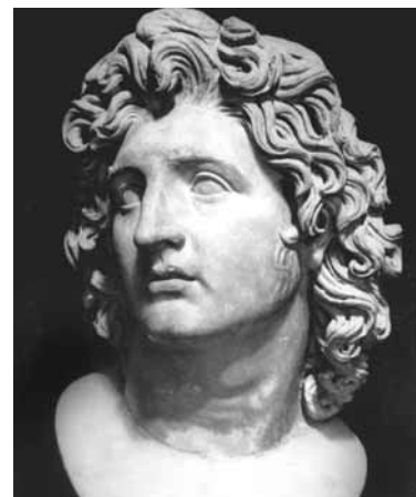
Der Aufstieg von Alexander dem Großen wurde von Daniel prophezeit, schon lange bevor Alexander seine Eroberungsfeldzüge antrat.

Daniel erfuhr, dass die Entweihung des Heiligtums „zweitausenddreihundert Abende und Morgen“ dauern sollte (Daniel 8,14). Zu den am Tempel durchgeführten Opferriten gehörten ein Morgen- bzw. Abendopfer. Zweitausenddreihundert Abende und Morgen sind also 1150 Tage. 167 v. Chr. entweihete Antiochus